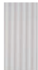
VENDOME 36P1 30x60 - 12"x24"