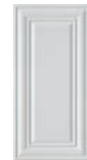
PLACE 36W 30x60 - 12"x24"