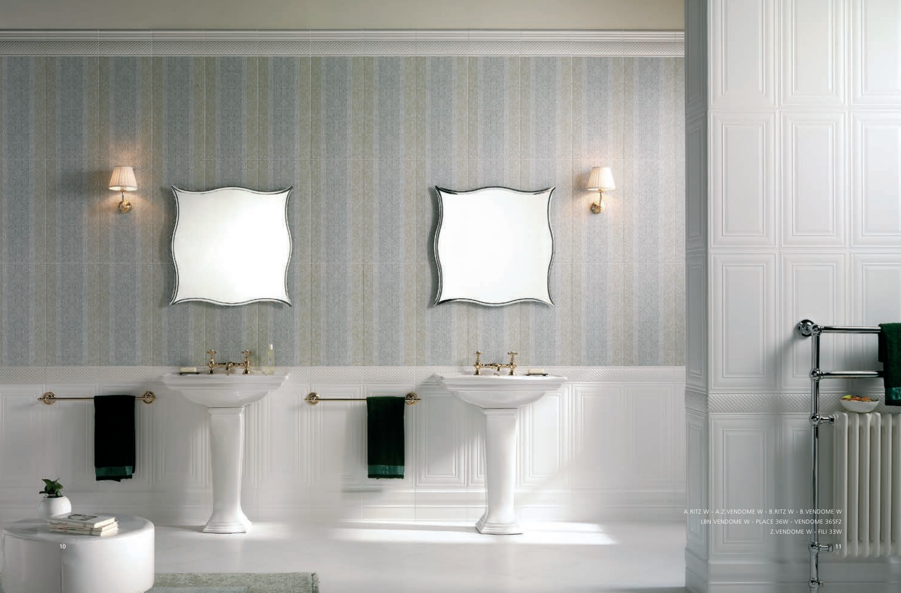
A.RITZ W - A.Z.VENDOME W - B.RITZ W - B.VENDOME W LBN VENDOME W - PLACE 36W - VENDOME 36SF2 Z.VENDOME W - FILI 33W