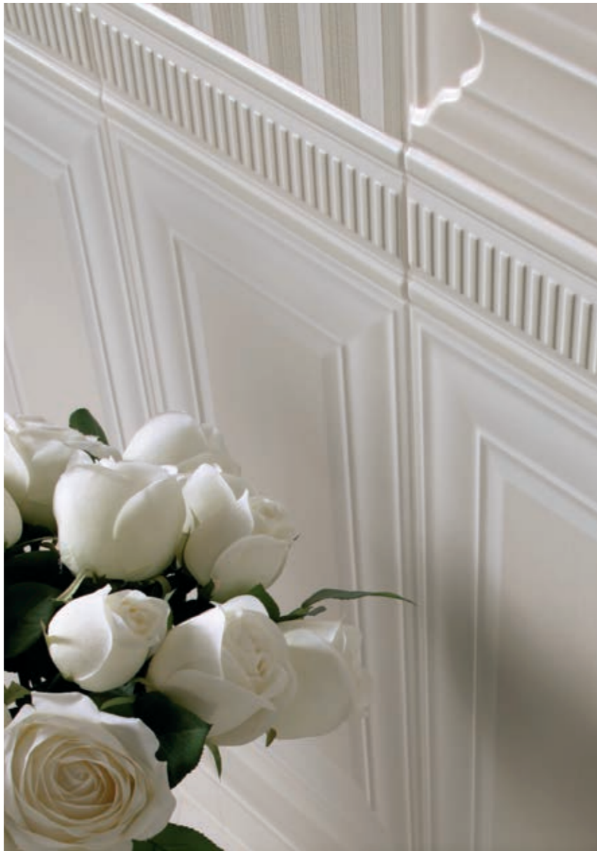
A.VOSGES B - A.Z.VENDOME B - B.VENDOME B - B.VOSGES B - LBN VENDOME B PLACE 36B - VENDOME 36S1 - VENDOME 36S2 - Z. VENDOME B